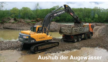
Aushub der Augewässer

Die Flussaufweitung Rosenheim ist Teil des Lifeprojektes “Lebensader Obere Drau” . Die Bauzeit erstreckt sich von November 2006 bis Juni 2007. Ziel ist es, flusstypische Lebensräume an der Drau, oberhalb der Rosenheimer Brücke, wieder herzustellen und die weitere Sohlerosion zu reduzieren. Der Schwerpunkt der Maßnahme liegt in