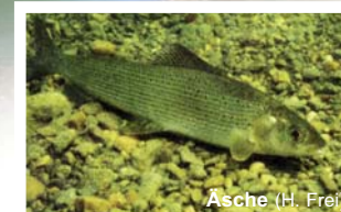
Äsche (H. Frei)