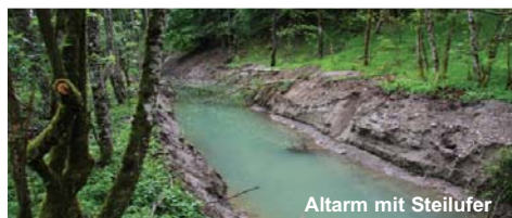
Altarm mit Steilufer

Beim Bau des Altarmsystems wurde auch bewusst auf die Herstellung von Steilufern geachtet. Steilufer sind an der Drau sehr selten und werden besonders vom Eisvogel als Brutareal benötigt. Der ganze Bereich bildet eine ideale Ruhezone für weitere sehr seltene Vogelarten, wie beispielsweise den Pirol.