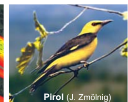
Pirol (J. Zmölnig)

Ein LIFE Projekt zur Wiederherstellung flusstypischer Lebensräume an der Drau.